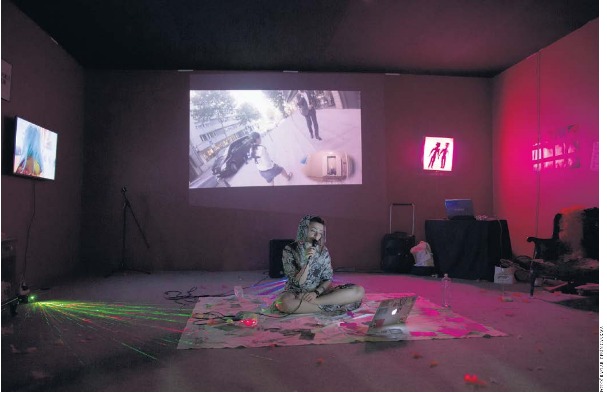
Leman Sevdâ Dancıoğlu'nun "Kimler Geldi, Kimler Geçti" performansından

kimlerle karşılaşacağımızı bilmesek dahi, Beylikdüzü'nde yapılan bir organizasyonda olmak bizi çok heyecanlandırıyordu. Keza bu, bir şekilde korunaklı hayatlarımızda sokakta yan yana geçmek dışında çok az bir temasızın olduğu bir kitleyle buluşmamız anlamına geliyordu.